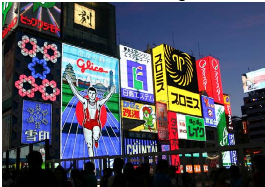
Leuchtreklamen mit Leichtathletik-Sujets haben es in Osaka bis ins Nachtleben geschafft.