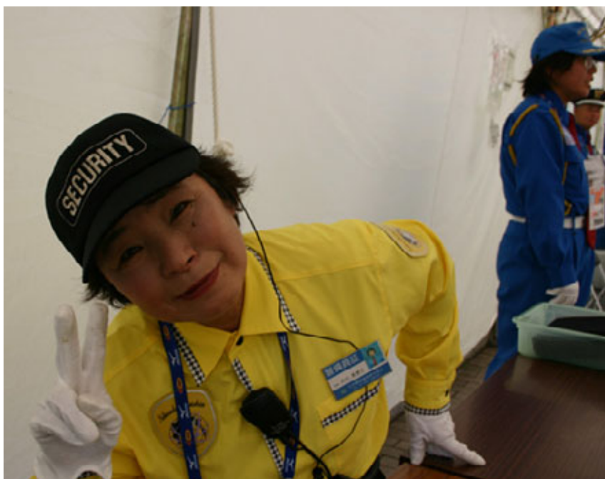
Freundlichkeit wurde großgeschrieben in Osaka, auch bei den Sicherheitskontrollen.