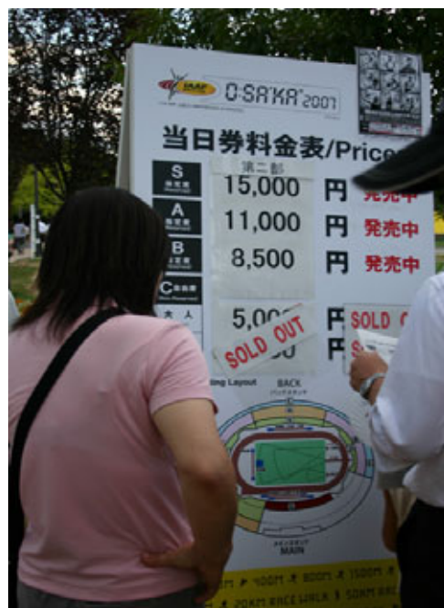
Ausverkauft waren nur Billigplätze um 30 €.